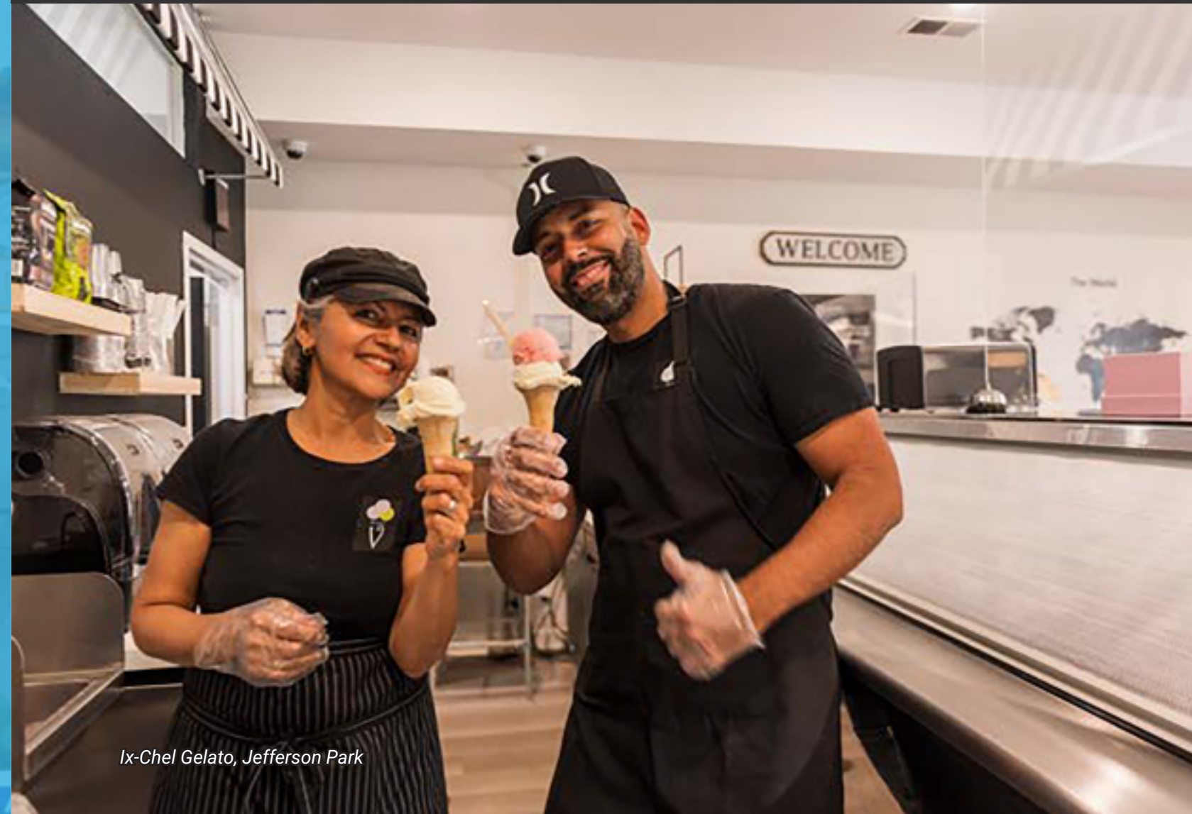
Ix-Chel Gelato, Jefferson Park