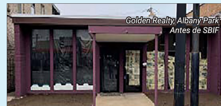
Golden Realty, Albany Park Antes de SBIF

Para obtener más información sobre las solicitudes visite www.chicago.gov/sbif . El sitio se puede traducir del inglés usando el menú desplegable en la esquina superior derecha.