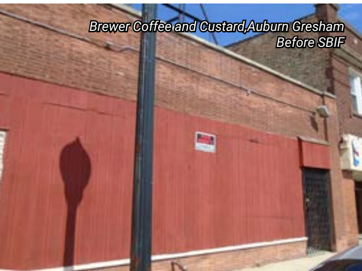
Brewer Coffee and Custard, Auburn Gresham Before SBIF

Applications and additional information are available at www.chicago.gov/sbif . The site can be translated from English by using the dropdown menu in the upper-right corner.