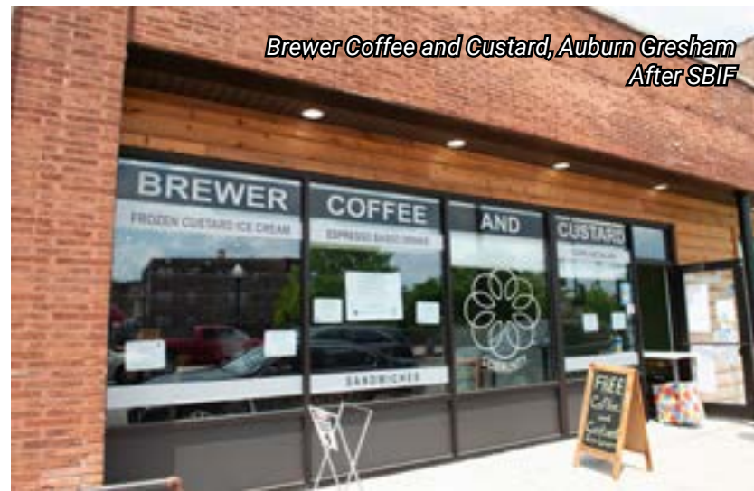
Brewer Coffee and Custard, Auburn Gresham After SBIF