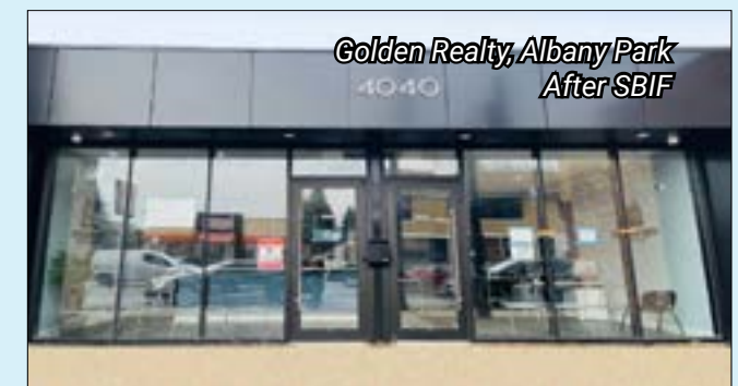
Golden Realty, Albany Park After SBIF