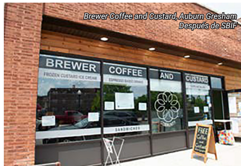
Brewer Coffee and Custard, Auburn Gresham Después de SBIF