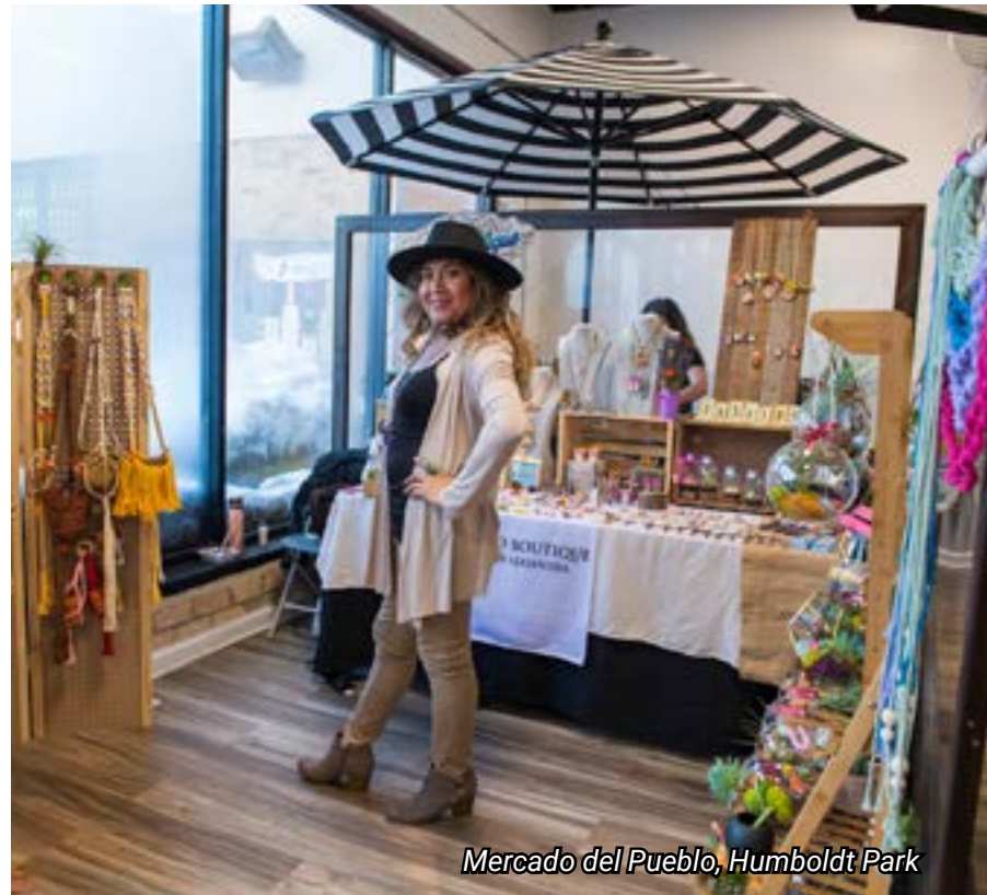
Mercado del Pueblo, Humboldt Park

SBIF program participants can receive grants covering between 30 percent and 90 percent of eligible project costs.