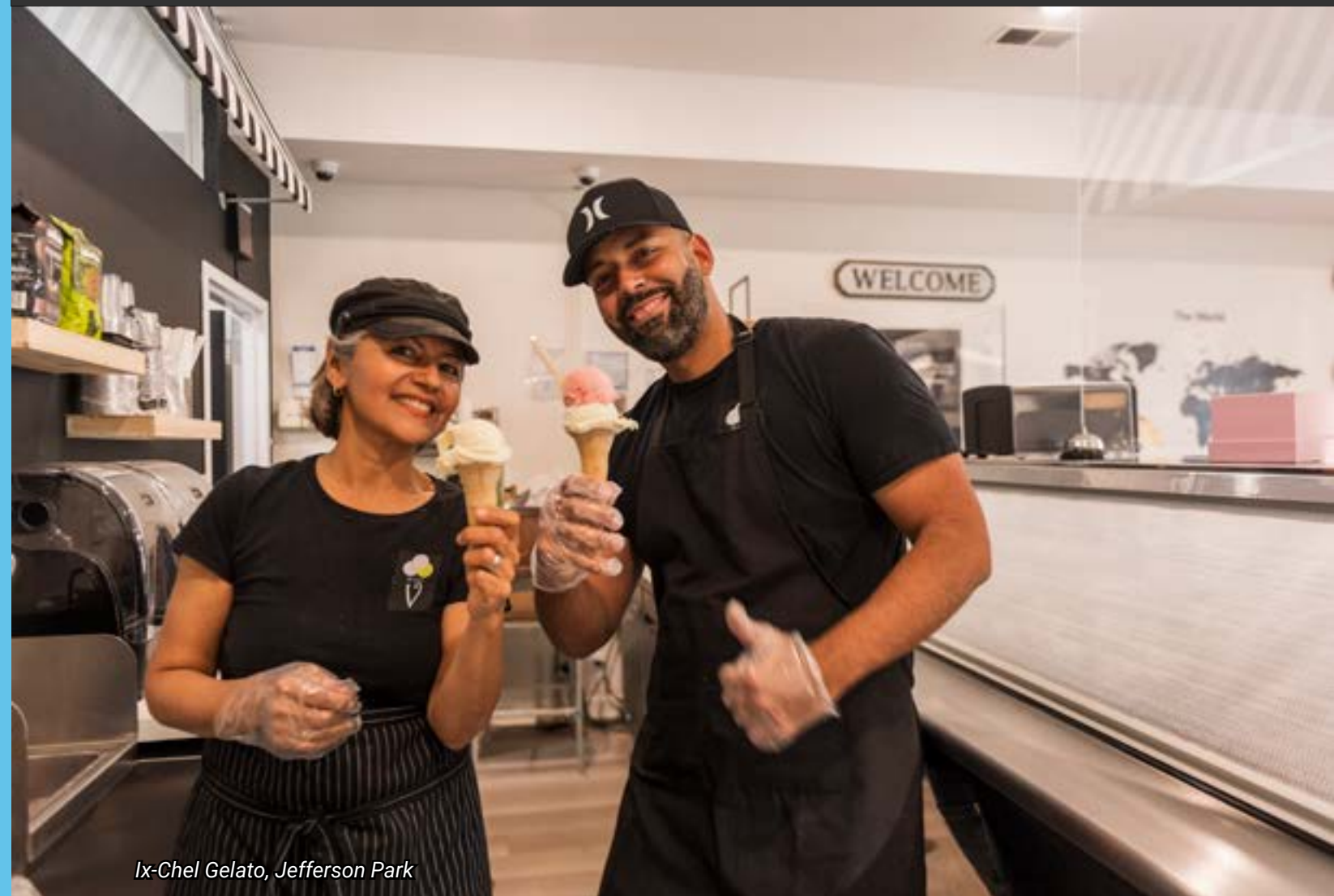
Ix-Chel Gelato, Jefferson Park