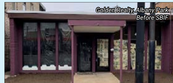
Golden Realty, Albany Park Before SBIF