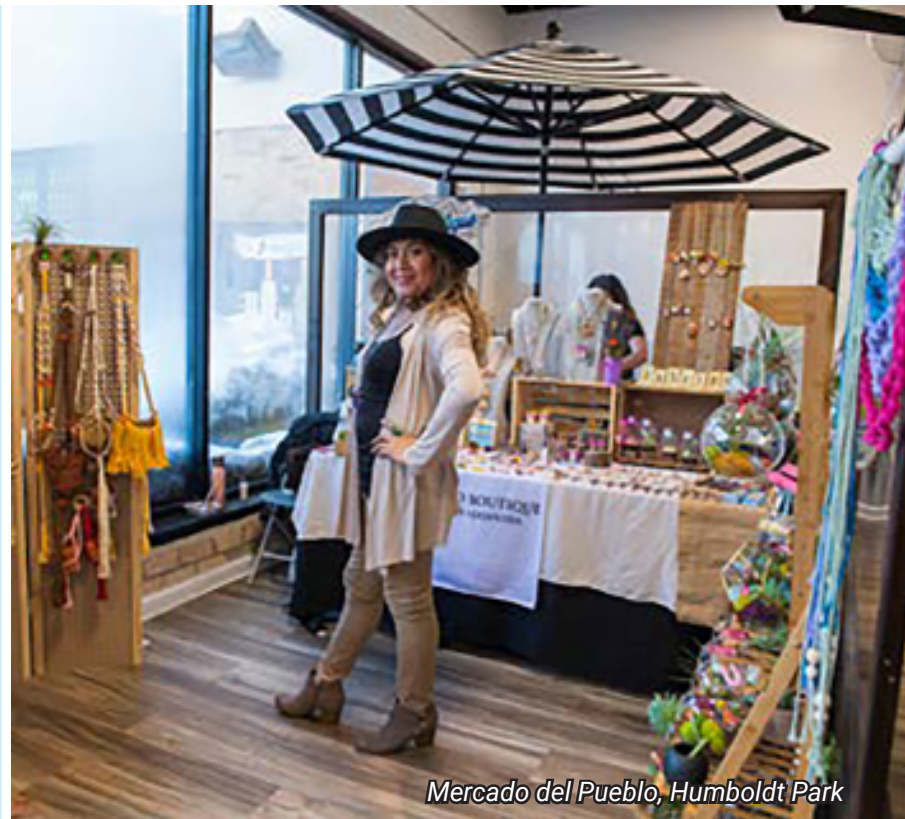
Mercado del Pueblo, Humboldt Park

Los participantes del programa de SBIF pueden recibir subvenciones que cubren entre 30 % y 90 % de los costos elegibles del proyecto.